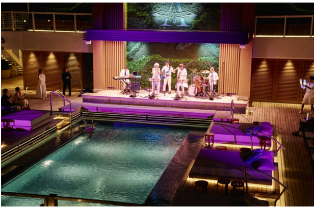
アルバトロスプール(11デッキ)