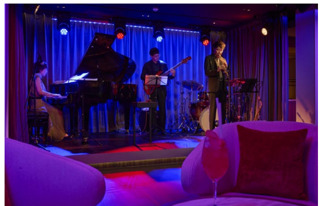
ビスタラウンジ(11デッキ)