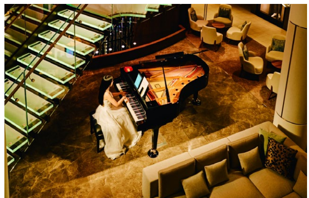
アスカプラザ(5デッキ)