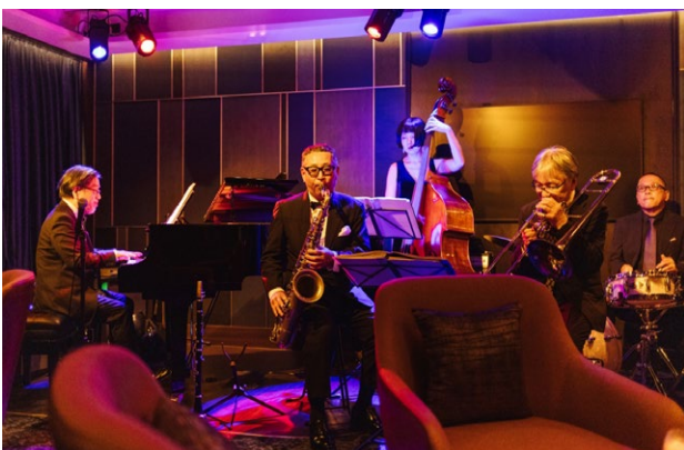
マリナーズクラブ(6デッキ)