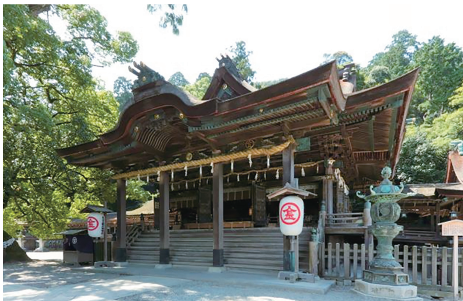
金刀比羅宮:写真提供(公社)香川県観光協会