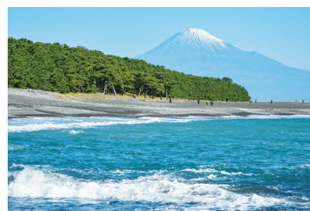
三保の松原から眺める富士山 (イメージ)

貸切バス会社 | 静鉄ジョイステップバス(株)、 アンピアバス、大鉄観光、または吉田観光(株)