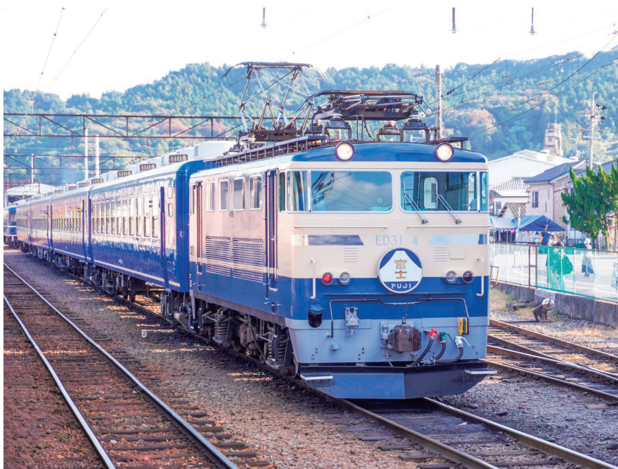
大井川鐵道(イメージ)

貸切バス会社 | 静鉄ジョイステップバス(株)、 アンビバス、大鉄観光、または吉田観光(株)