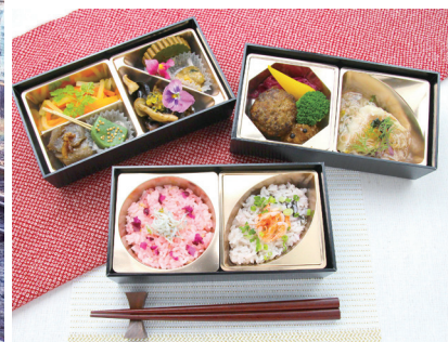
お料理弁当(イメージ)