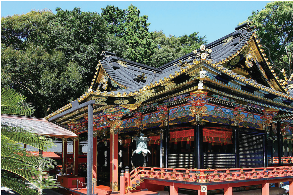
久能山東照宮