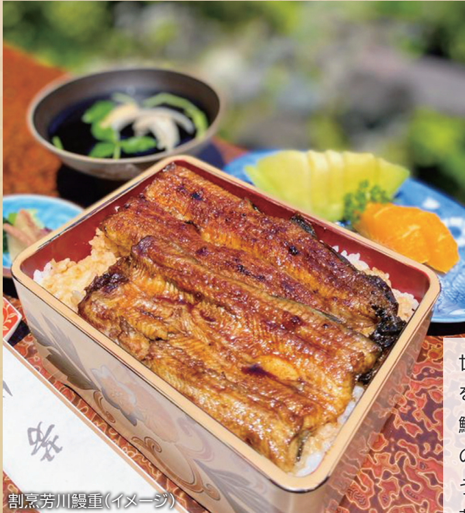
割烹芳川鰻重(イメージ)