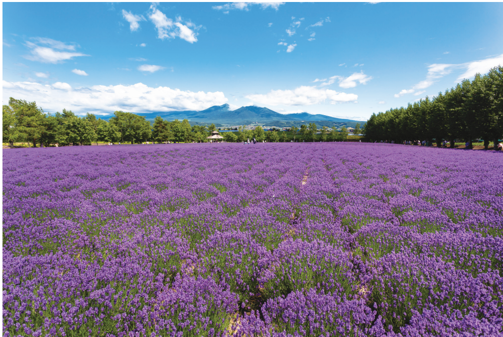
ラベンダー畑(イメージ)