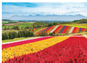
四季彩の丘 (イメージ)

貸切バス会社 | てんてつバス(株)、沿岸バス(株)、 深川観光バス(株)、または(株)北海運輸