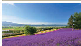
ラベンダー畑(イメージ)

貸切バス会社 | てんてつバス(株)、沿岸バス(株)、 深川観光バス(株)、または(株)北海運輸