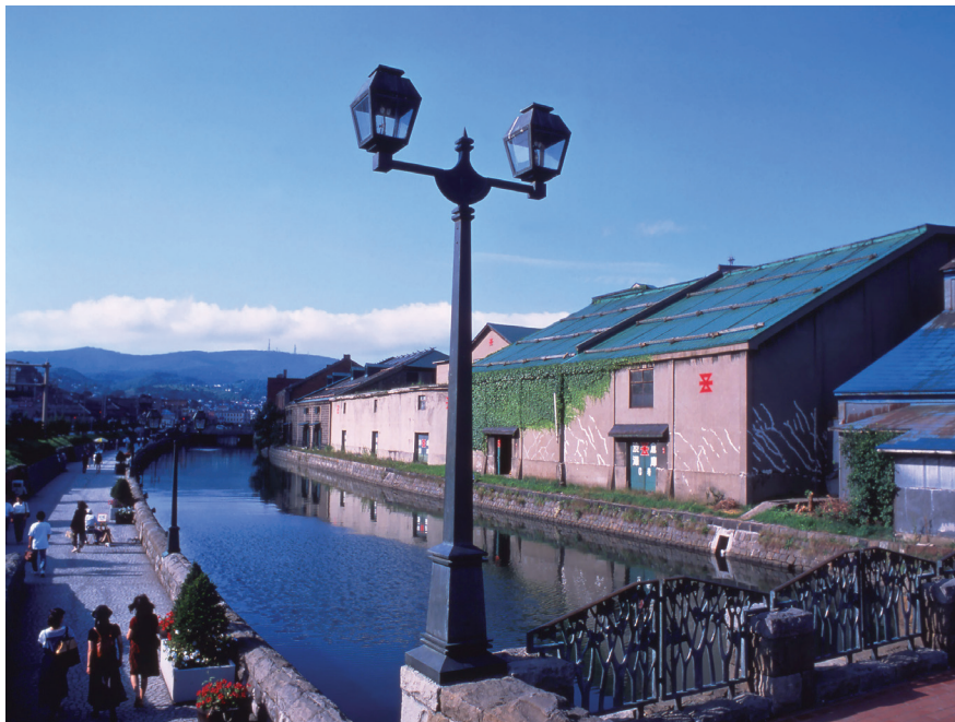
小樽運河