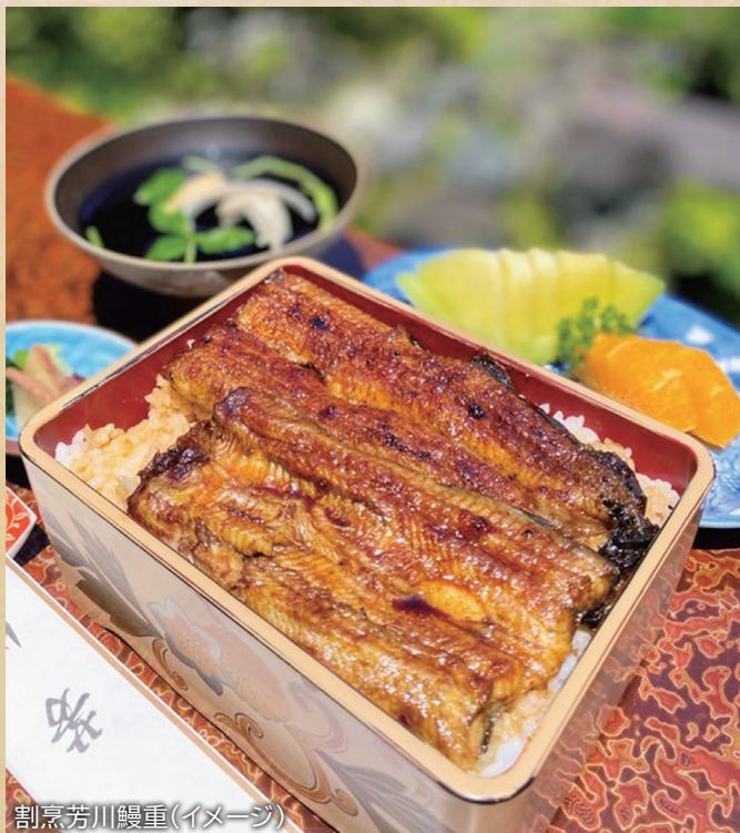
割烹芳川鰻重(イメージ)